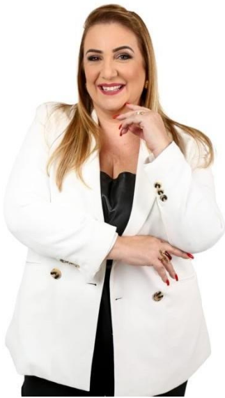
HELENA ALMEIDA - PORTUGAL