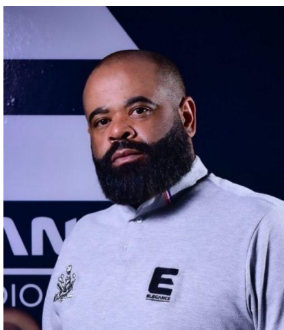
AMARAL BARBER- BRASIL