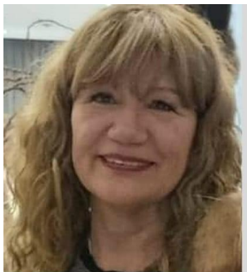
SELVA MONTAÑA – ARGENTINA